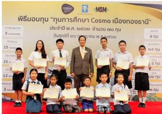
ดูรูปทั้งหมด

ข่าวทั่วไป ThaiPR.net -- พุทธศักราช 2562 16:14:46 น.